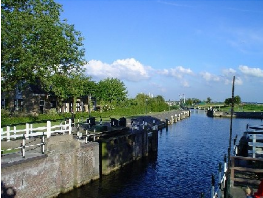
Het Benedensas staat op de Werelderfgoedlijst.